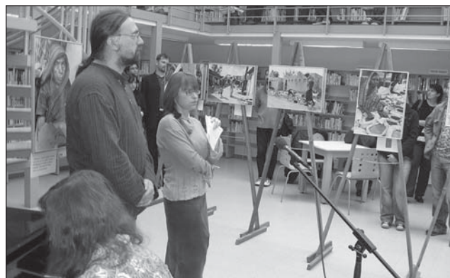
Výstava fotografií p. Zuchnického na téma „Indie – kroky naděje, fotografie byly pořízeny na podporu projektu Diecézní charity Hradec Králové Adopce dětí na dálku.