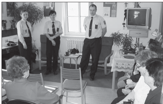
Beseda se strážníky Městské policie, která byla velmi zajímavá. Tímto bychom chtěli ještě jednou za tuto akci poděkovat.