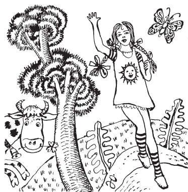
Kresba: Jindřich Oleš

Prvního června český konstruktér a vynálezce Josef Božek poprvé předvedl veřejnosti parní loď na Vltavě v Praze (1817), Emil Zátopek jako první atlet historie zaběhl v Bruselu 10 kilometrů pod 29 minut (1954) a signál SOS byl zaveden jako celosvětový standard volání o pomoc (1908). 1. 6. je Mezinárodním dnem dětí, tento den má upozornit světovou veřejnost na práva a potřeby dětí. Oslavu dne dětí navrhla v roce 1949 Mezinárodní demokratická federace žen, Mezinárodní odborové sdružení učitelů a Světová federace demokratické mládeže. Mezinárodní den dětí se poprvé slavil 1. června 1950 ve více než 50 zemích celého světa. Pevné datum, tedy 1. červen, bylo stanovena až na